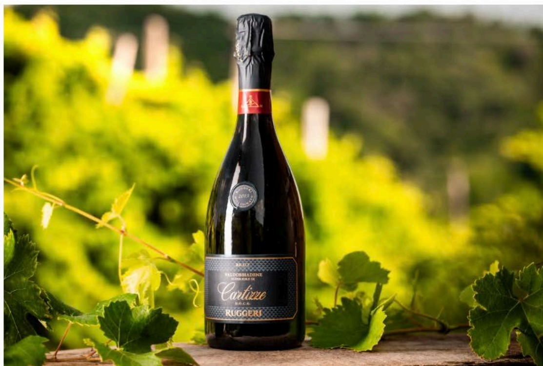
Ruggeri ha lanciato il suo primo Cartizze Brut Millesimato 2023